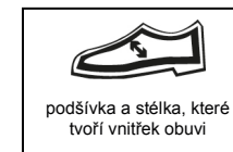
podšívka a stélka, které tvoří vnitřek obuvi