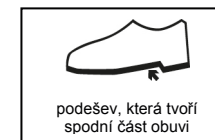
podešev, která tvoří spodní část obuvi